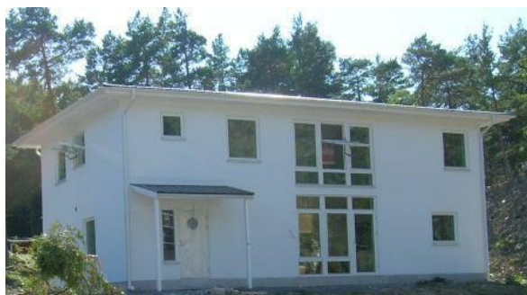
JK Villan från Kollberg & Co är ett modernt arkitektoniskt hantverk i nyfunkisstil som andas rymd och känsla.

Kollberg & Co AB är specialiserade på att producera villor - JK Villan - för familjen. Vi har lagt ner möda på att utforma huset med stor flexibilitet för att lätt kunna anpassas till hela familjens behov och krav. Varje familj har sina egna idéer och drömmar om det perfekta huset vilket gör att varje JK Villa är unik i sitt slag.